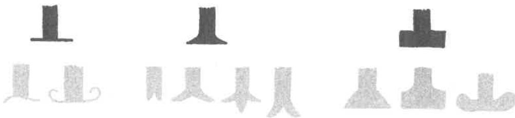
Roman, Bodoni und Egyptienne (v.l.n.r.).